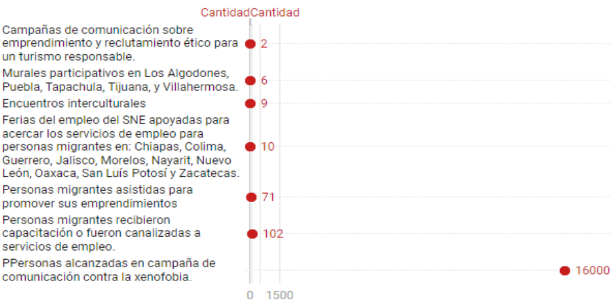
Gráfico: Diana Arce • Descargar los datos • Creado con Datawrapper

La OIM impulsó el acceso a vías regulares de migración, a través de oportunidades laborales con condiciones dignas, y promovió la aceptación de las personas migrantes en las comunidades de acogida.